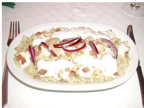
HALUŠKOVÝ FESTIVAL Veňarec - Novohradská župa

KÍSÉRŐ PROGRAMOK – sprevádzajúce programy: 2009. szeptember 12. szombat VANYARC - Nógrád megye