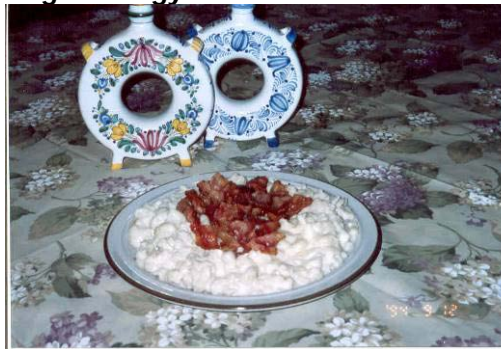
HALUSCHKAFESTIVAL in Vanyarc im Komitat Nógrád