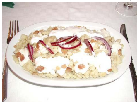
HALUŠKOVÝ FESTIVAL Veňarec - Novohradská župa